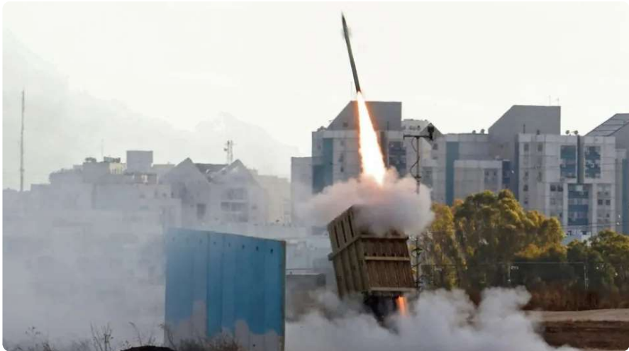
El Domo de Hierro de Israel intercepta cohetes.

El año pasado, Israel también compró ocho aviones KC-46A Boeing Pegasus por un estimado de US$2.400 millones. Estos son capaces de repostar aviones como el F-35 en el aire.