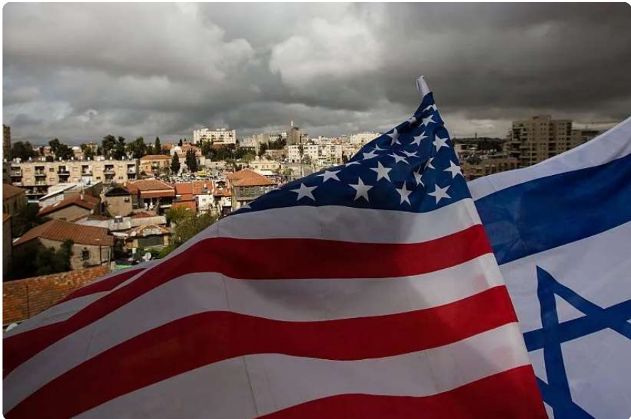
Banderas de EE.UU. e Israel

Luego de la última escalada de violencia entre israelís y palestinos, el presidente Joe Biden enfrenta cuestionamientos de algunos miembros de su Partido Demócrata sobre la cantidad de ayuda que Estados Unidos envía a Israel.