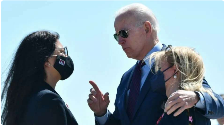
El presidente Biden ha enfrentado presiones por la ayuda estadounidense a Israel de algunos demócratas como Rashida Tlaib (izq.).

"Los funcionarios estadounidenses y muchos legisladores han considerado durante mucho tiempo a Israel un socio vital en la región".